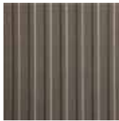
09 CARINUS neutro nell'ambiente