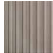
06 CINIS leggiadro e pulito