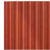
07 RUBIN elegante con grazia