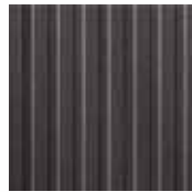
10 NIGRA scuro