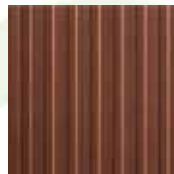
04 PRUNUS elegante con stile