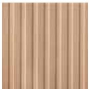
01 PICEA Semplice e leggero