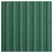
08 FLORA puro e naturale